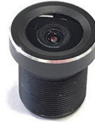
블랙박스용 카메라 렌즈