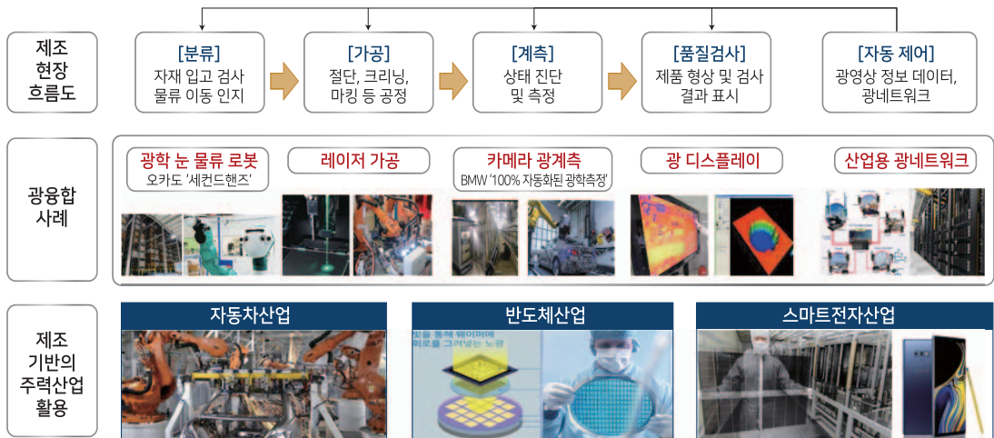
그림 2 | 주력산업 제조 현장 적용 광융합 사례