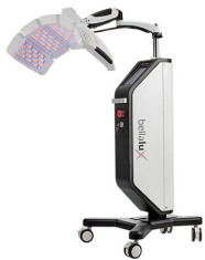
LED 피부질환치료기 벨라룩스