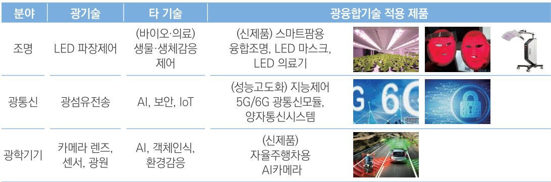
표 1 | 광융합기술 적용사례