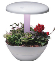
LED 식물재배기 PARPOT