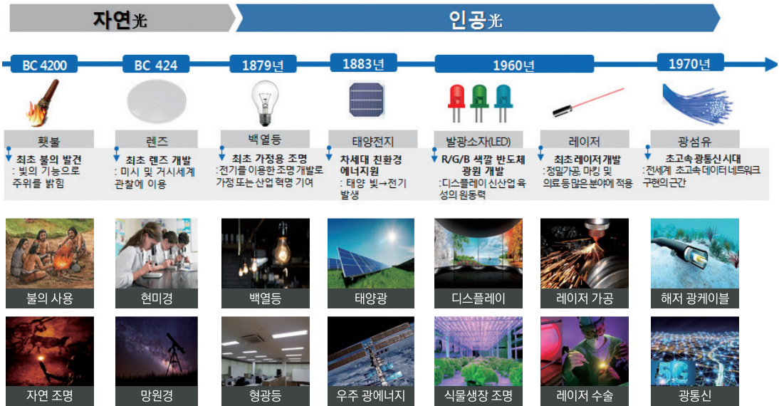
| 그림 1 | 광산업의 발전과정